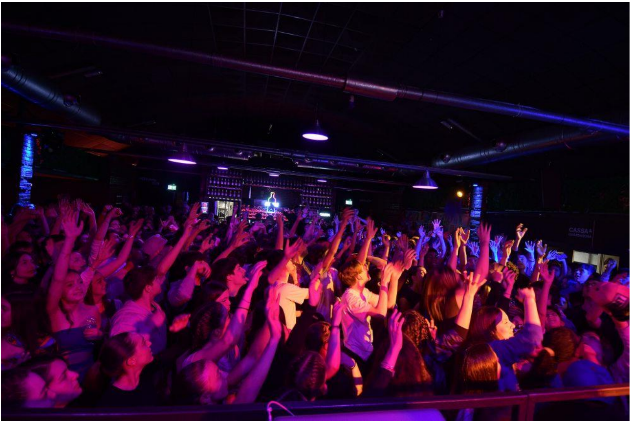
immagine di archivio, festa di benvenuto con volleydance