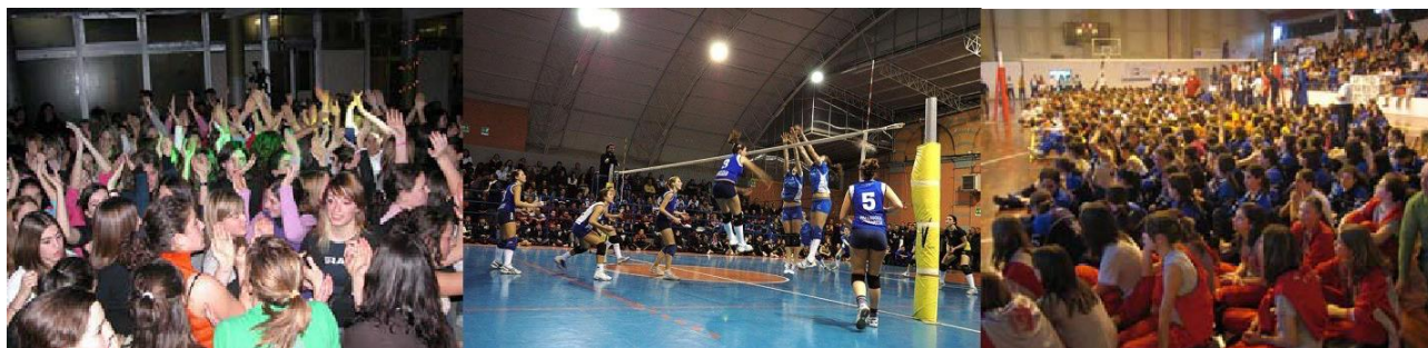
IMMAGINI DI ARCHIVIO: VOLLEYDANCE (1), FINALI (2), PREMIAZIONI (3).

L'esercizio delle OPZIONI 1 e 2, per mere ragioni organizzative è vincolante per tutta la comitiva ovvero sia per atleti, dirigenti, allenatori e accompagnatori tra i quali rientrano anche i genitori iscritti alla manifestazione.